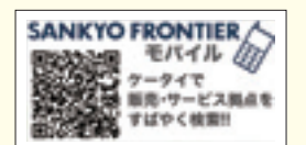
モバイル版ホームページ