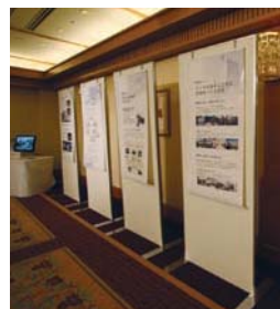
三協フロンテアの理念やユニットハウスをご理解いただくため、製品模型によるプレゼンテーションやビデオ上映なども行いました。