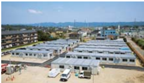
新潟県中越沖地震の応急仮設住宅

の水廻りをシステム化することや、施工スピードを短縮できる製品開発に取り組んでいます。これからも、災害発生時には、被災者の心身の安全と安定した生活を確保できるよう復興支援してまいります。