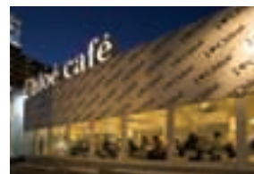
夜間のライトアップ